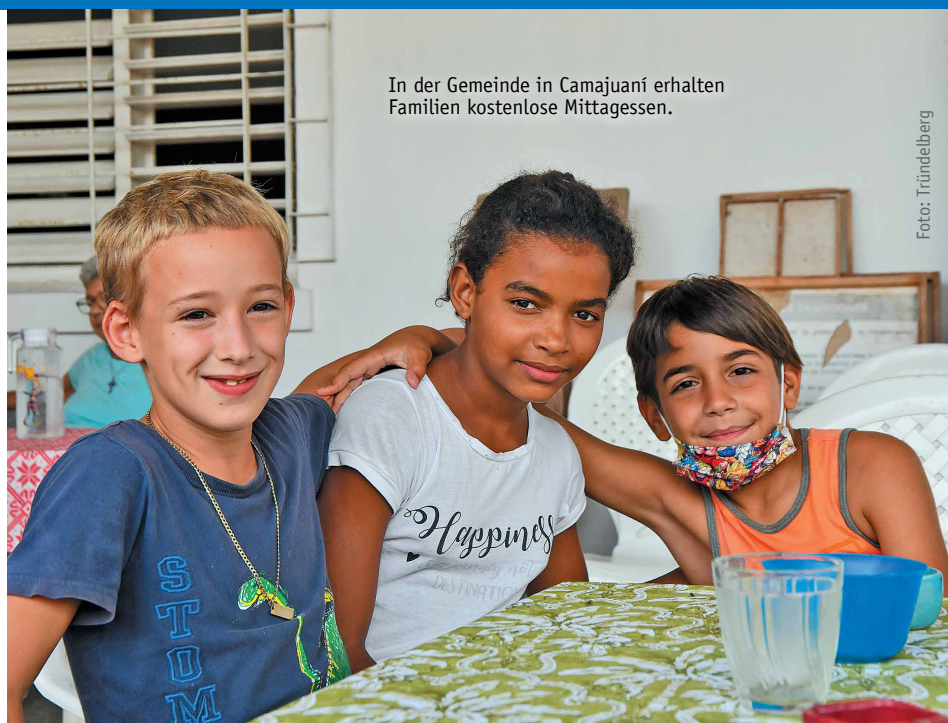
In der Gemeinde in Camajuani erhalten Familien kostenlose Mittagessen.

Neben den genannten Projekten unterstützt das Jahresprojekt in Kuba auch die Arbeit mit Kindern in einer Elendssiedlung, lokale Konfliktbearbeitung mit Binnenmigranten und Seminare für Frauen in der Kirche. Außerdem sammelt das Jahresprojekt für den Stipendienfonds des GAW und weitere Projekte, die Frauen stärken. Wir brauchen 105.000€, um diese Vorhaben zu ermöglichen.