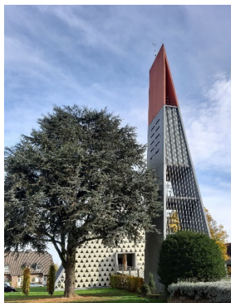
Gastgebende Gemeinde Kevelaer