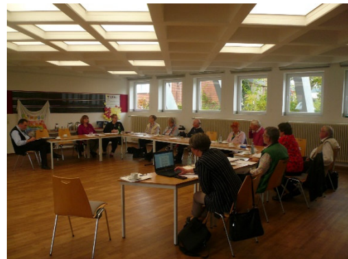
Tagung in der Ev. Kirchengemeinde Kevelaer