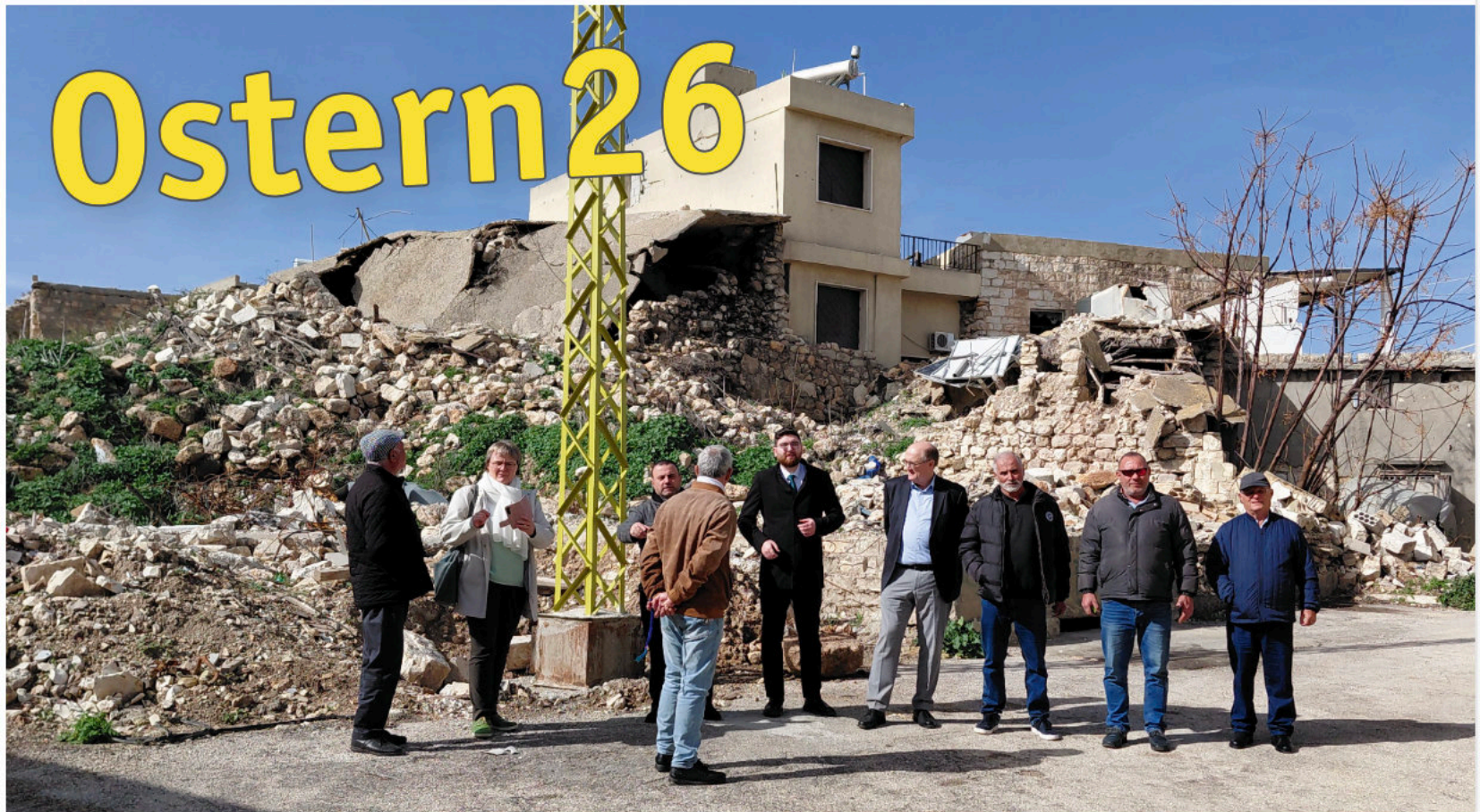
Libanon im März 2026 / Foto Enno Haaks