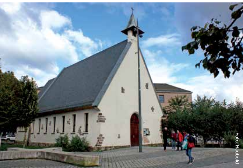
Das GAW hat die Sanierung der Versöhnungskapelle 2020 und 2025 unterstützt.