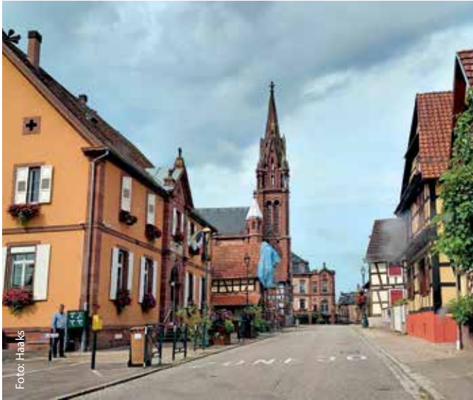
Fröschwiller mit Friedenskirche: Nach 2024 unterstützt das GAW die Sanierung dieses Verständigungsortes in diesem Jahr erneut.