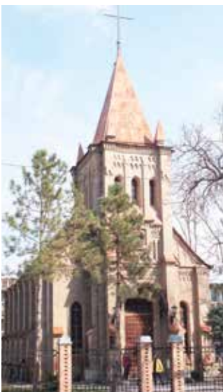
Die historische lutherische Kirche in Taschkent

Noch reicht die Anzahl der Mitglieder aus, damit die Gemeinde staatlicherseits registriert sein kann. Die Zahl der Mindestmitglieder eine Gemeinde liege bei 105. Damit gehören die Protestanten zu den kleineren christlichen Gemeinschaften. Neben