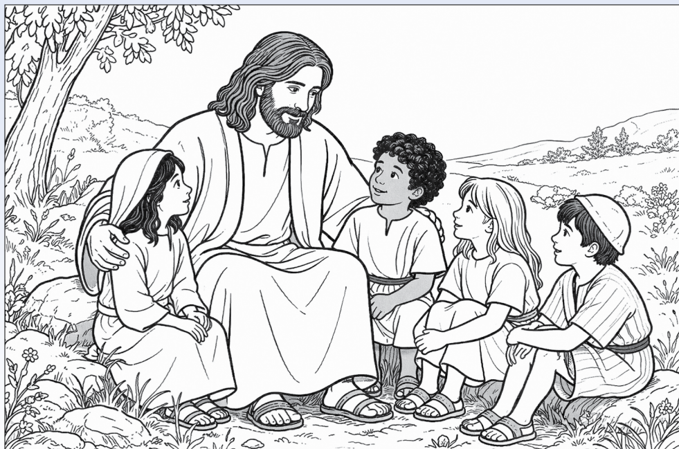
Jesus und die Kinder. Male das Bild in bunten Farben aus.

Denk an ein Kind – zum Beispiel aus deiner Klasse. Überlege, warum dieses Kind für dich besonders ist und was du an diesem Kind magst.