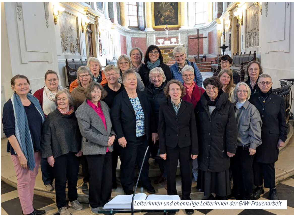
Leiterinnen und ehemalige Leiterinnen der GAW-Frauenarbeit