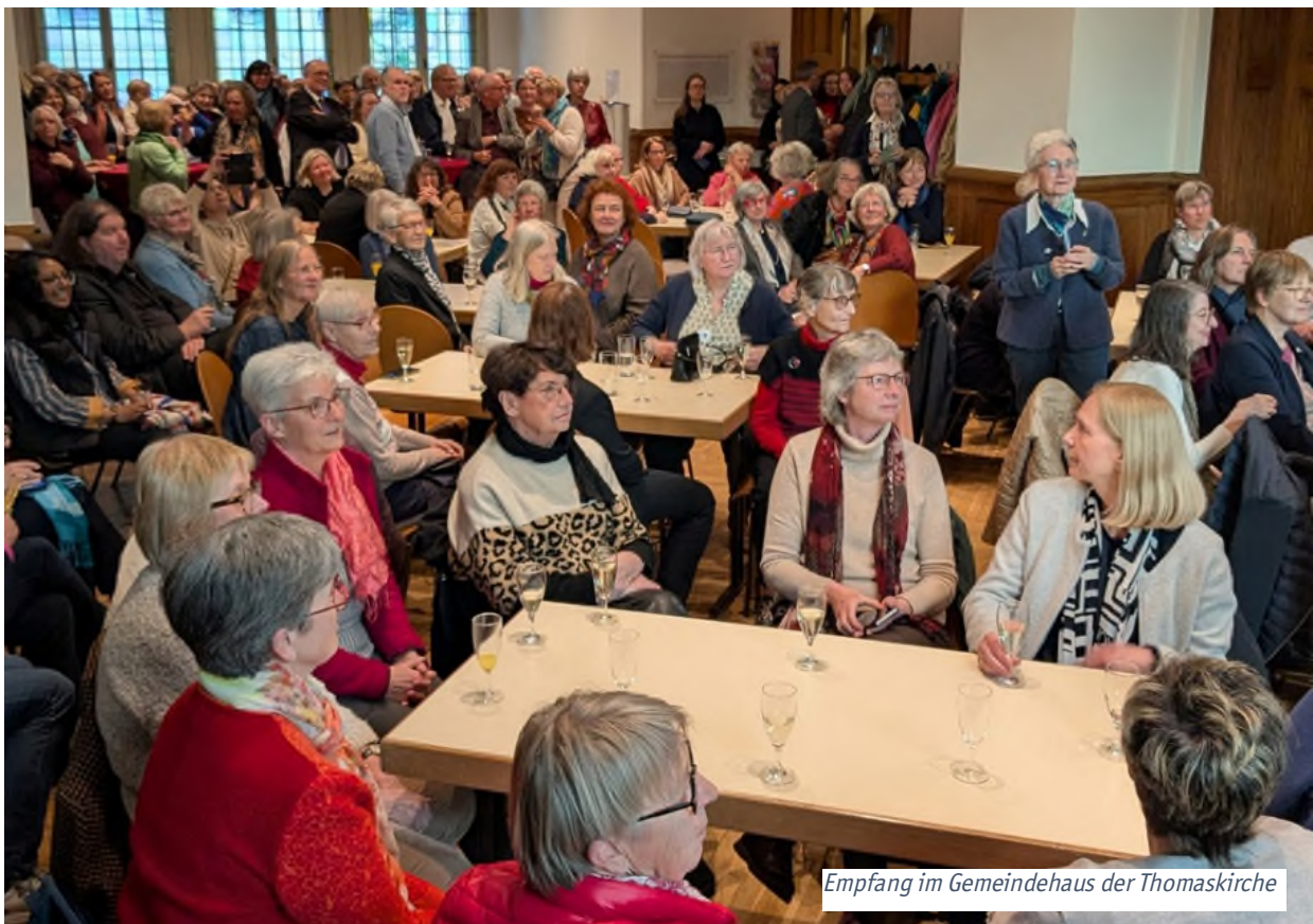
Empfang im Gemeindehaus der Thomaskirche