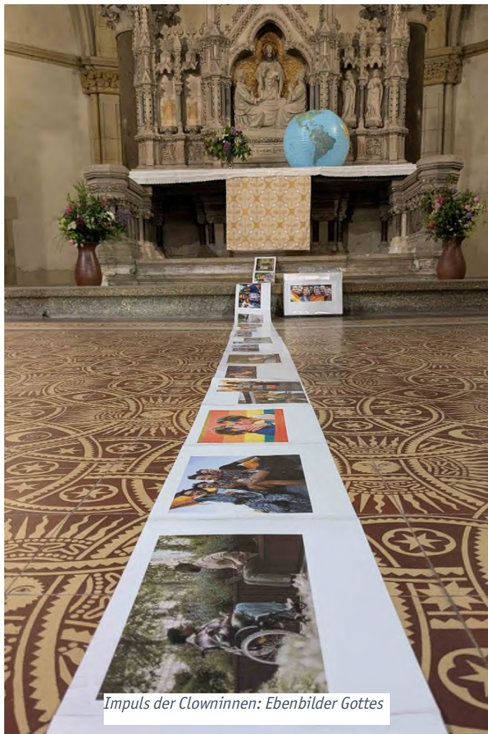
Impuls der Clowninnen: Ebenbilder Gottes