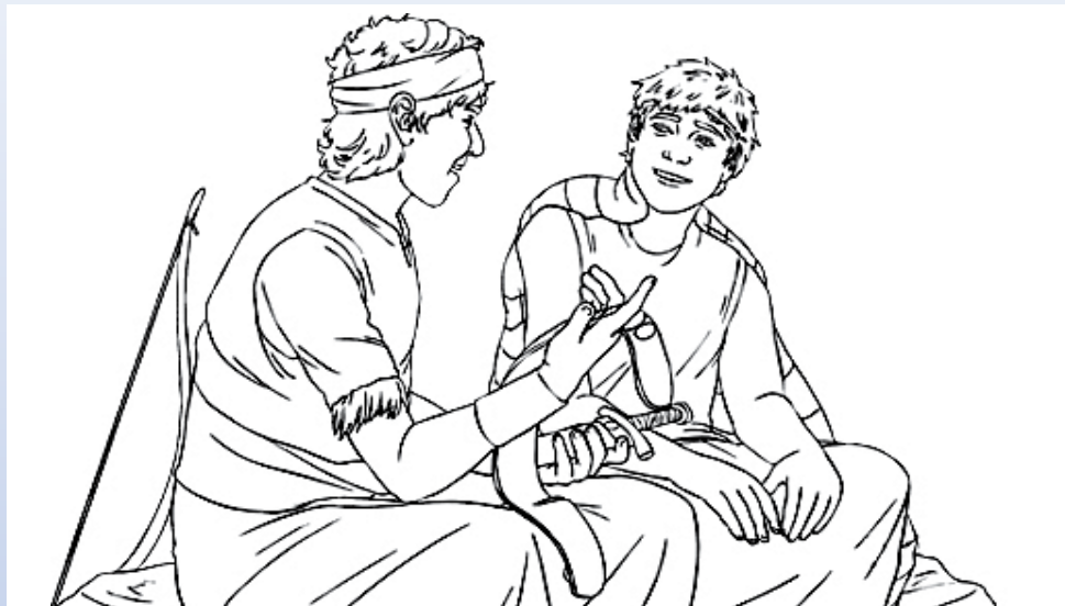
David und Jonatan waren beste Freunde. Male das Bild aus.

Der Hirtenjunge David hatte mit Gottes Hilfe den Riesen Goliath besiegt. Und weil David so stark war, holte König Saul ihn an seinen Hof. Dort lernten David und Jonatan sich kennen und wurden Freunde. Zum Zeichen seiner Freundschaft schenkte Jonatan David seinen Mantel, seine Rüstung, sein Schwert, den Bogen und den Gürtel. König Saul sah die Freundschaft zwischen den beiden nicht gern. Er wusste, dass Gott David zum König machen wollte. Für Jonatan war das okay. Doch König Saul wurde schließlich so wütend, dass er David nach dem Leben trachtete. Aber es gelang König Saul nicht, David umzubringen. Denn immer wieder warnte Jonatan seinen Freund David.