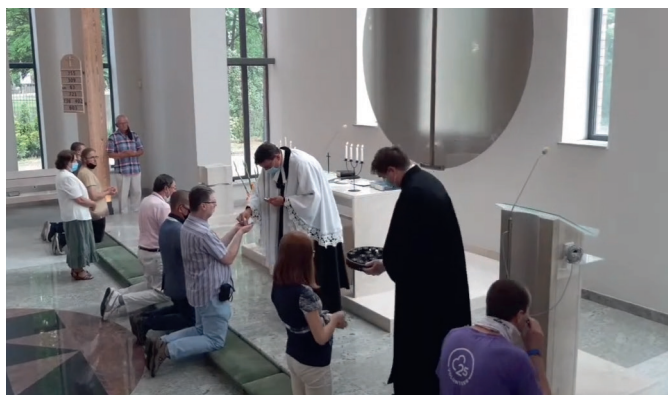
Abendmahl in Posen. Ein Kind freut sich über das neue Tablet.