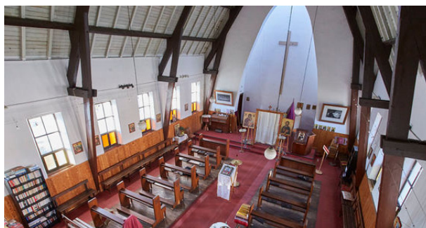
Kirchenraum als Raum, der Begegnung möglich macht.

Wer hat sie nicht gesehen – die herzerwärmenden Bilder von Liebespaaren, die sich in Lockdown-Zeiten am Grenzübergang begegnen? Sich begegnen, zusammenleben und füreinander einstehen – besonders essentiell in Zeiten, in denen in und um Europas Kirchen Anschläge verübt werden. Und in denen weiterhin viel über den Zusammenhalt in der Europäischen Union diskutiert wird. Zwei Städte zeigen, dass und wie es geht, das Zusammenwachsen in Europa: Zwischen Kehl am Rhein und Straßburg wächst ein neuer Stadtteil heran, Port du Rhin, in dem künftig etwa 20.000 Menschen leben werden. Die Evangelische Landeskirche in Baden und die Union Protestantischer Kirchen von Elsass und Lothringen begleiten