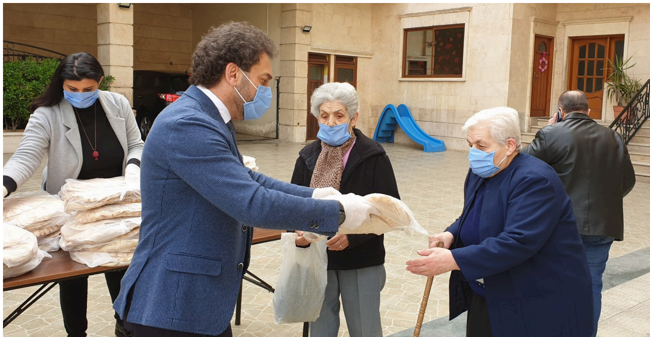
Hilfe, Hoffnung und Brot für alle Generationen.

Die Bethelschule ist eine der ältesten armenischen Schulen in Syrien. Sie wurde 1923 von Menschen gegründet, die den Völkermord der Regierung des Osmanischen Reiches überlebt und in Aleppo Zuflucht gefunden hatten. Der