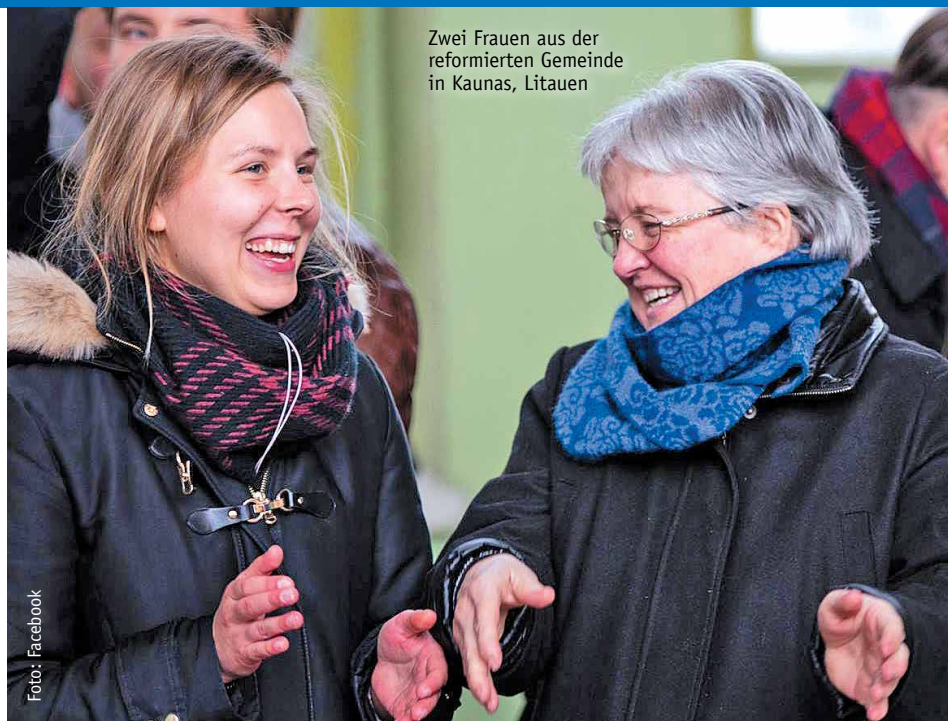
Zwei Frauen aus der reformierten Gemeinde in Kaunas, Litauen

Neben den genannten Projekten unterstützt das Jahresprojekt ein Familiendorf für Waisenkinder in Lettland, den Stipendienfonds des GAW und weitere Projekte, die Frauen stärken. Wir brauchen 105.000 €, um diese Vorhaben zu ermöglichen.